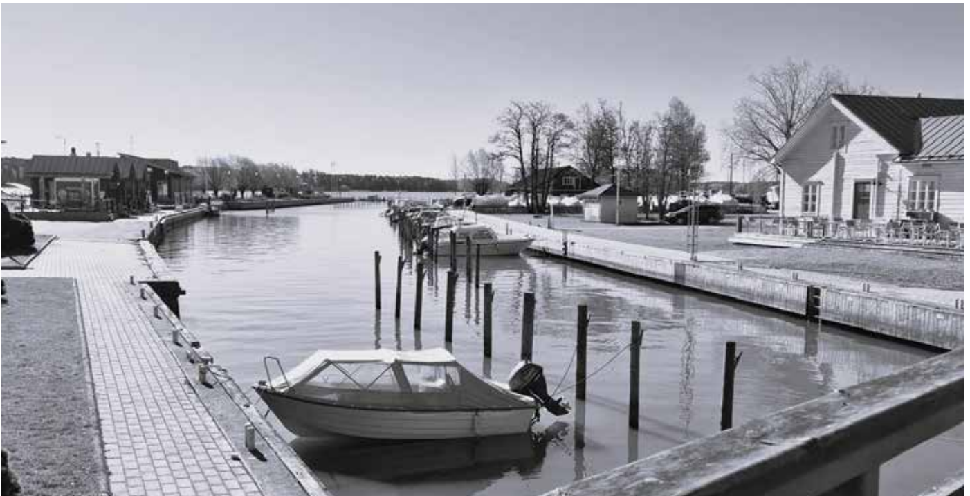
Iloinen Inkoo kesäisenä.