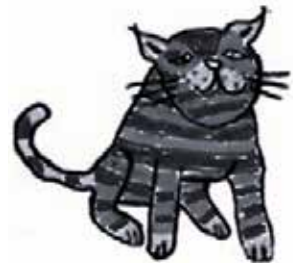
Kirkkonummen Seudun Mielensterveysyhdistys Kisu ry

Kirkkonummen Seudun Mielensterveysyhdistys Kisu ry on Kirkkonummen seudun suomen- ja ruotsinkielisten mielensterveyskuntoutujien oma yhdistys. Kisu ry ylläpitää kohtaamispaikka Kimiä Kirkkonummen keskustassa, Eerikintörmässä. Yhdistyksen tavoitteena on edistää ja tukea Kirkkonumme-laisten ja sen lähiseudun asukkaiden hyvinvointia, hälvittää yksinäisyyttä sekä tukea arjessa pärjäämistä tarjoamalla avointa ja vastikkeetonta toimintaa ja vertaistukea. Edistämme osallistujien osallisuutta lähiseutumme yhteisiin tapahtumiin.